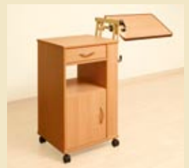
dino mit höhenverstell- und schrägstellbarer betttischplatte