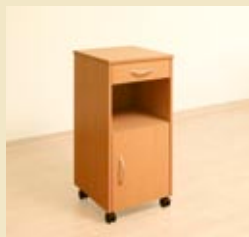
dino ohne betttischplat- te

dekor buche sonderdekore und ausfüh- rungen auf anfrage