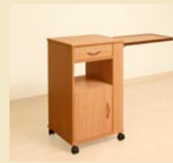
dino mit ausklappbarer betttischplatte