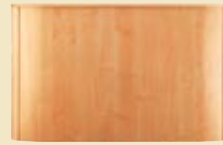
buche hell oder buche natur

neben den hier gezeigten dekorkombinationen können auch ihre speziellen farbwünsche berücksichtigt werden