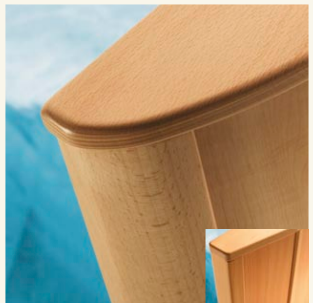
formschönes fuß- und kopfteil